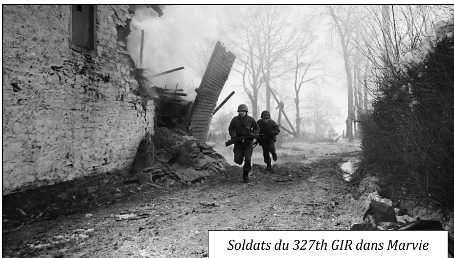
Soldats du 327th GIR dans Marvie